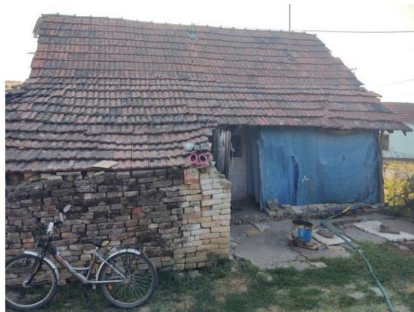
Stambeni objekat br.1