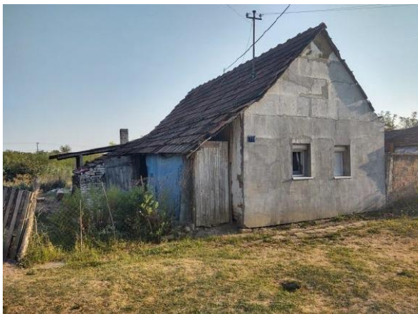
Stambeni objekat br.1